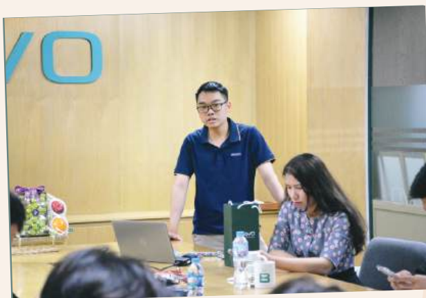
Truyền năng lượng